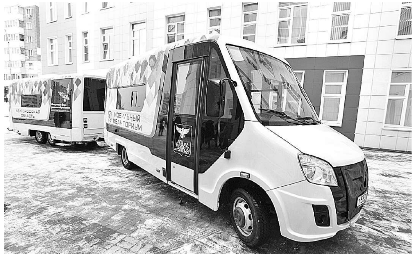
Мобильный технопарк «Кванториум»

КАК МОБИЛЬНЫЙ «КВАНТОРИУМ» ПОМОГ ОХВАТИТЬ ДОПОБРАЗОВАНИЕМ ТЕХНИЧЕСКОЙ НАПРАВЛЕННОСТИ УЧЕНИКОВ СЕЛЬСКИХ ШКОЛ