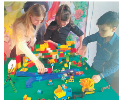
Студия мультипликации в Доме детского творчества