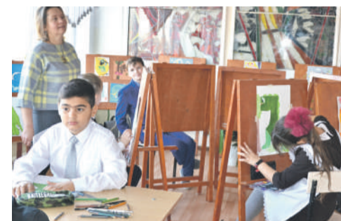
В изостудии школы № 4