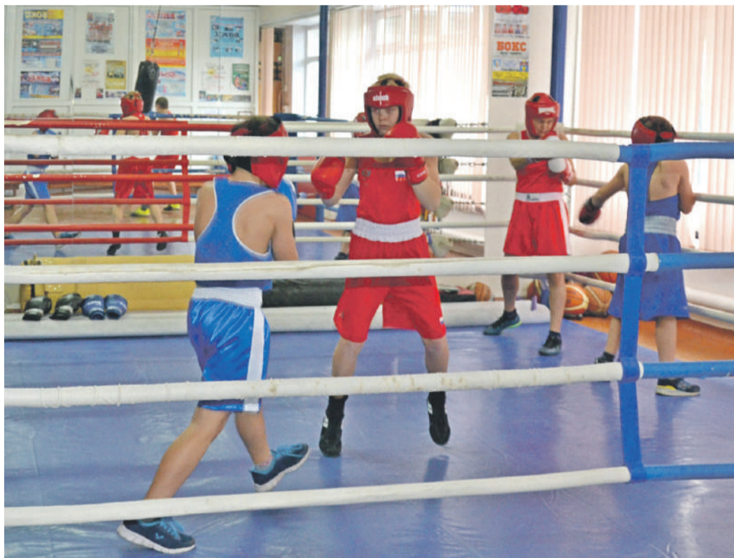
Тренировки по боксу в школе № 4