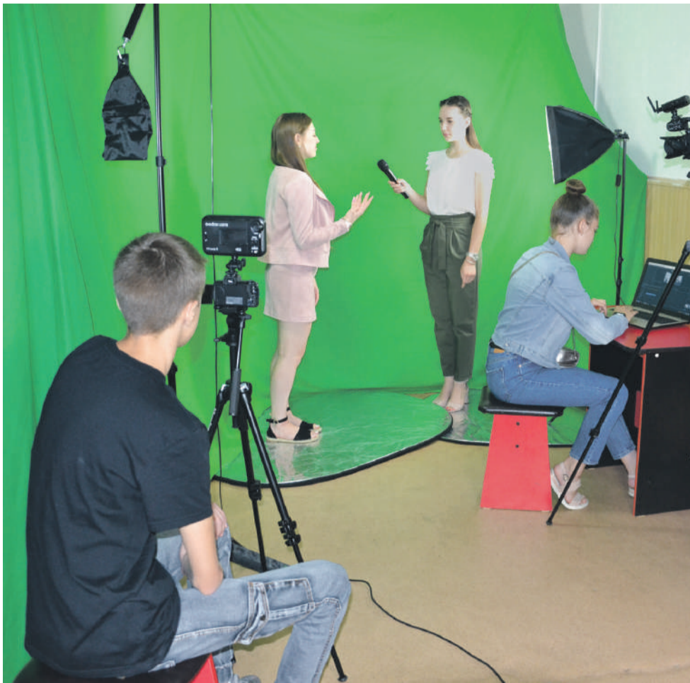
В школьном медиацентре «МедиаДикт» школы № 1