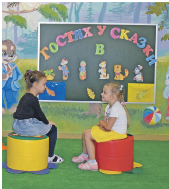
В детском саду № 4