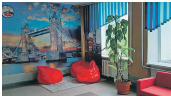
Рекреационная зона в школе № 1