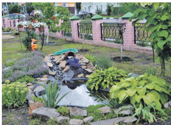
Ландшафтный дизайн на территории школы № 2