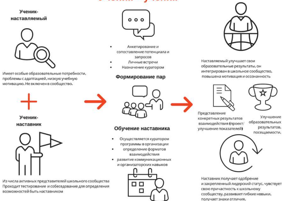
Рисунок 1. Графическое представление реализации программы наставничества по форме «ученик – ученик».