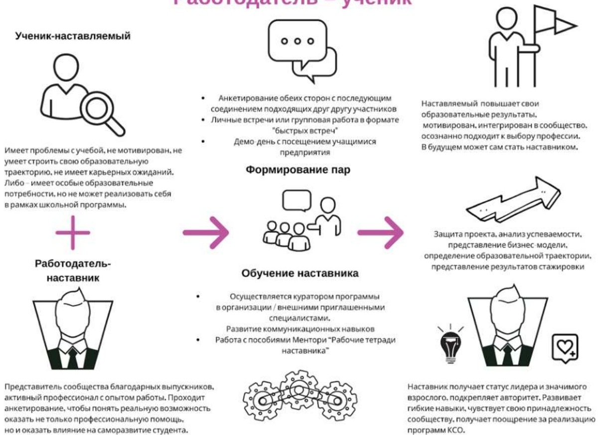
Рисунок 4. Графическое представление реализации программы наставничества по форме «работодатель – ученик».