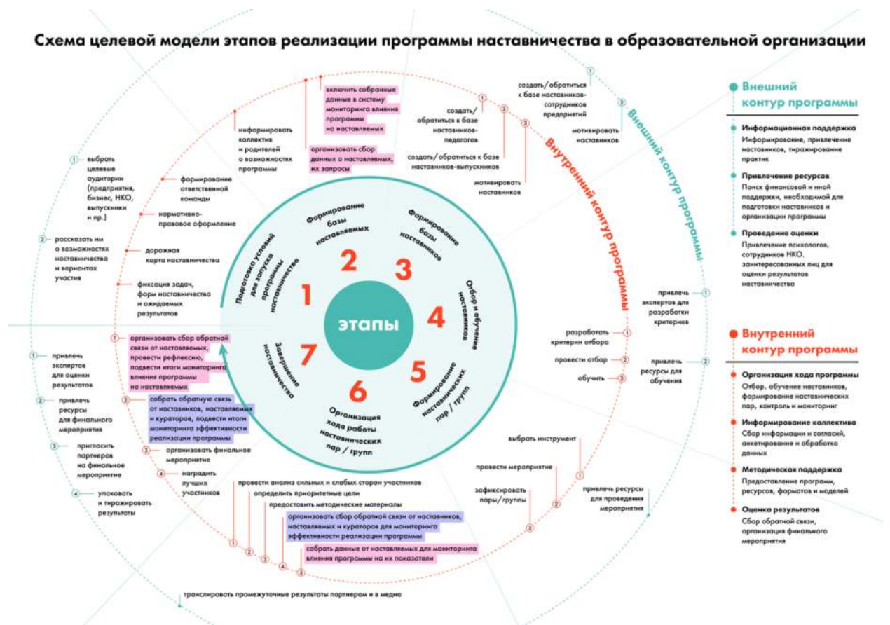
Рис. 6. Схема целевой модели этапов реализации программы в образовательной организации

Содержание каждого этапа, представленное в виде направлений работы с внутренним и внешним контурами, содержится в таблице 1 «Целевая модель этапов реализации программы наставничества в образовательной организации». В таблице 2 «Целевая модель программы наставничества в образовательной организации» представлены основные компоненты программы наставничества.