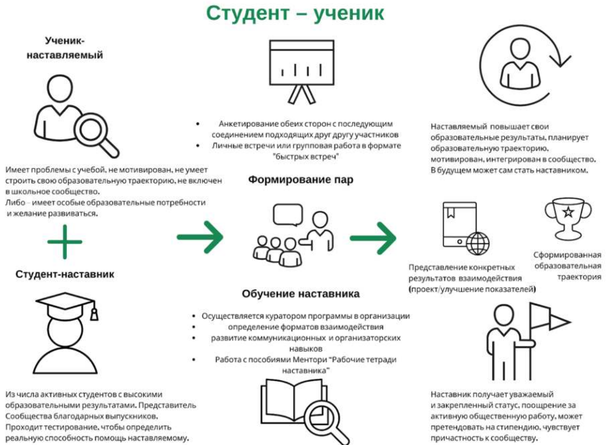
Рисунок 3. Графическое представление реализации программы наставничества по форме «студент – ученик».